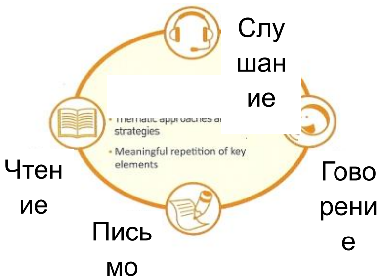
Рисунок 2 Связь лингвистических практик

На уроках, где используется технология CLIL, учащиеся видят, что с помощью английского языка можно получать новую интересную информацию. Изучение языка становится осмысленным, так как он используется для изучения определенного предмета и выполнения конкретных задач и упражнений. На занятиях по методике CLIL используются аутентичные (то есть разработанные для носителей языка) материалы и ресурсы образовательных англоязычных сайтов: http://www.iupac.org/ , http://www.learnerstv.com/ , http://www.chem1.com/chemed/genchem.shtml , http://www.chemistrylecturenotes.com/html/student_resources.html . Свободный доступ к Интернету обеспечивает возможность применения аудио-, видео-, мультимедиа- и материалов, способствующих формированию практических навыков: чтения, говорения, слушания, письма (reading, speaking, listening, writing). Таким образом на каждом занятии и при подготовке к домашним заданиям учащиеся практикуют свои навыки (рис. 2).